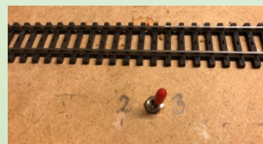
Her vises tværbommen og tænd/sluk knappen.