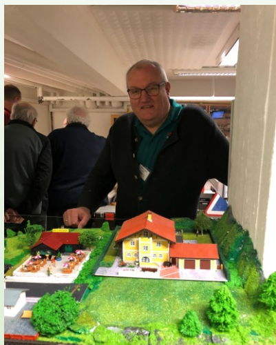
Villa "Berghof" er ved at blive placeret i alpelandet.