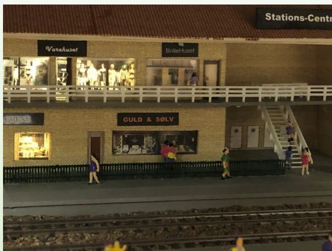
Stationen under jorden er også i brug.