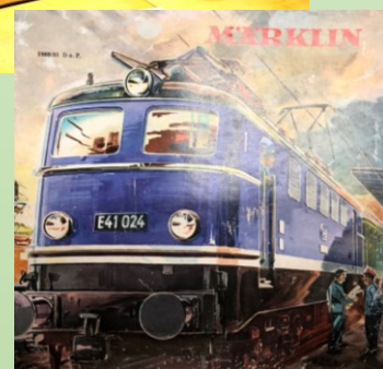
Detektiverne på jagt – Det må da være en gammel model fra 60-erne?